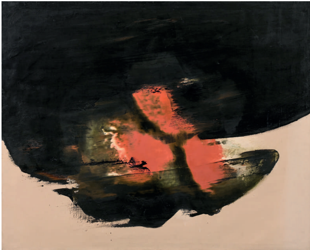
Judit Reigl, Écriture en masse - Transformation III , 1961, Huile sur toile, 83 x 104 cm