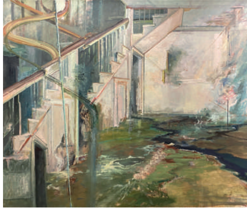
Ra'anan Levy, Hommage à Edgar Allan Poe , 2020 Huile sur toile 166 x 197 cm