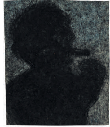
Michel Haas, Fumeur , 1978 Technique mixte dans papier 61.8 x 51 cm