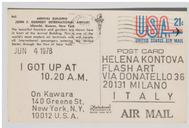
On Kawara, I GOT UP AT 10:20 A.M. , 1978 Impression photomécanique sur carte postale timbrée et affranchie 9 x 14 cm