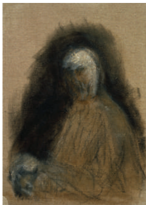
Zoran Music, Autoportrait , 1990 Huile sur toile 65 x 46 cm