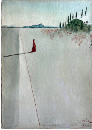
Salvador Dalí, Départ pour le grand voyage, illustration pour l'Enfer , 1951 Aquarelle et encre sèpia sur papier 41.9 x 29.9 cm